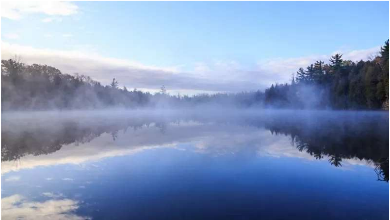
دریاچه کرافورد فروچاله سنگ آهکی است که پر از آب شده است

فسیلی را می‌توان در آن مشاهده کرد به همین دلیل این مکان شاخص خوبی برای سنجش میزان تأثیر فعالیت‌های انسانی در زمین بر محیط زیست است.