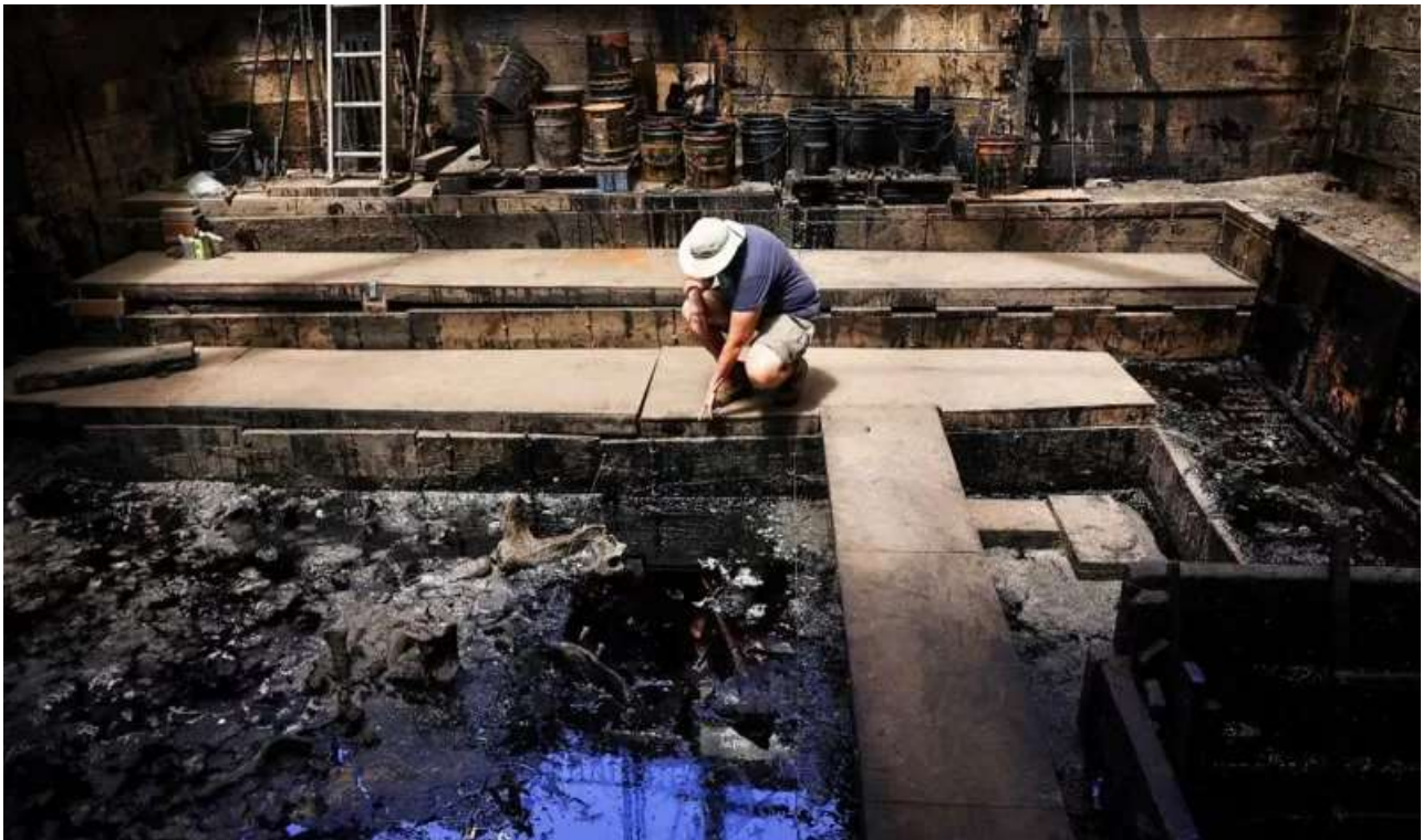
محققان مشغول کار در گودال شماره ۹۱ این محوطه، ۱۷ اوت ۲۰۲۳

کشف شده در این محوطه به آنها امکان می‌دهد زمان مرگ حیوانات را با دقتی بالا - حداکثر خطای چند ده سال - رقم بزنند. آنها برای این مطالعه نمونه‌های بیش از ۱۷۰ حیوان از هفت گونه درشت اندام شامل ببر دندانخنجری، نوعی گرگ، شیر، شتر، گاومیش کوهان‌دار، اسب و اسلات (تنبل) را تحلیل کردند. این گونه‌ها حدود ۱۳ هزار سال قبل از این منطقه ناپدید شدند. آنچه بعد از آن تاریخ در گودال‌های لا بریا پیدا می‌شود فقط نوعی کایوتی (گونه‌ای مشابه شغال) است. البته این علاوه بر پستانداران کوچک مثل سنجاب است.