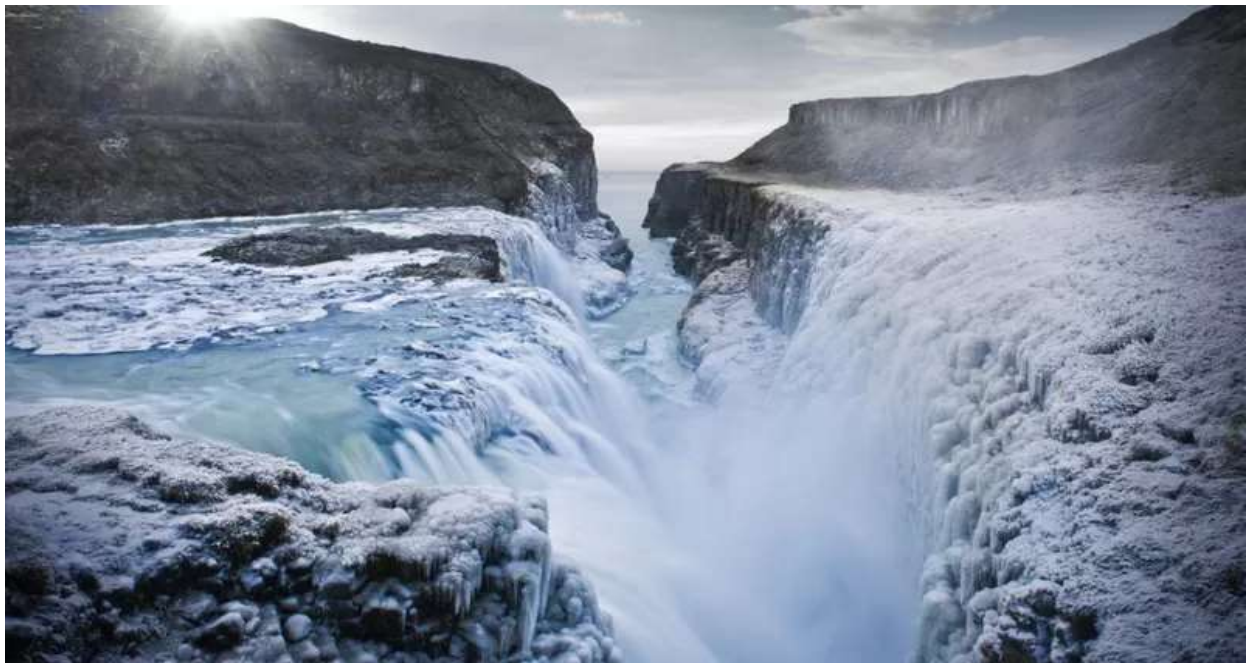
عصر یخبندان زمانی بود که دمای سراسر زمین بسیار پایین آمده بود

تازه‌ترین دوره زمانی دور هولوسن است که حدود ۱۱,۷۰۰ سال پیش و کمی پس از عصر یخبندان شروع شده است.