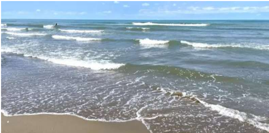
تصاویر ماهواره‌ای جدید نشان می‌دهد دریای خزر، بزرگ‌ترین دریاچه جهان به سرعت در حال کوچک شدن است.

طور کامل خشک شده است. بر اساس گزارش رسانه‌ها کوچک شدن دریای خزر به شدت روی اکوسیستم و اقتصاد و تجارت دریایی در مناطق اطراف این دریاچه در قزاقستان تاثیر گذاشته است.