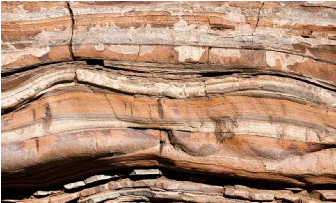
لایه‌های سنگی نشان‌دهنده تاریخ دیرین زمین هستند

در این دوران وضعیت آب‌وهوایی ثبات بیشتری پیدا کرد و نشانه آن را در چینه‌های باقی‌مانده از این دوران می‌توانیم مشاهده کنیم.