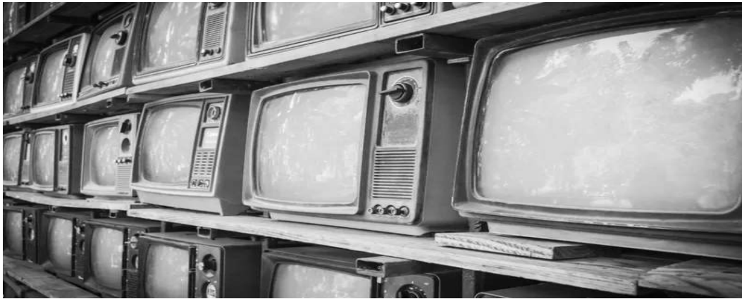
فناوری‌هایی مانند تلویزیون در حدود سال ۱۹۵۰ به طور گسترده در دسترس قرار گرفت

عمل تفاوتی با هولوسن ندارد. اتحادیه بین‌المللی علوم زمین‌شناسی، گروهی که مقیاس‌های زمانی زمین‌شناختی را تعیین می‌کند هنوز به طور رسمی وضعیت و اصطلاح آنتروپوسن را تأیید نکرده است.