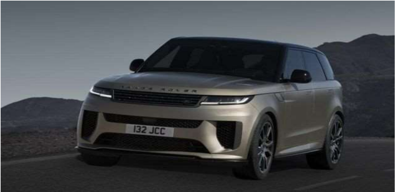
رنج روور اسپرت SV، مدل تقویت شده‌ای از شرکت لندروور