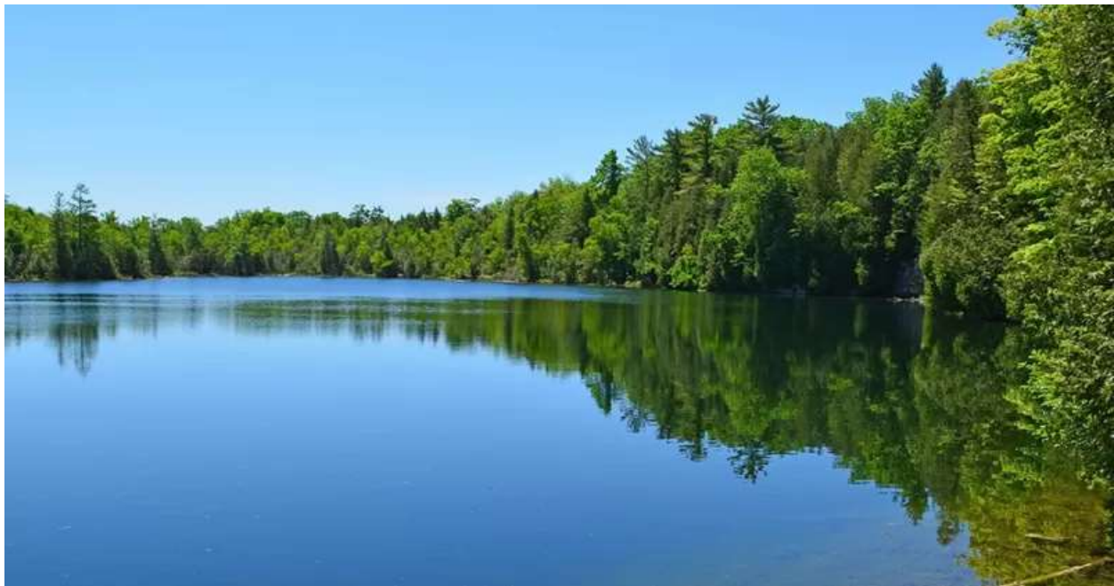
دریاچه کرافورد فروچاله سنگ‌آهکی است که پر از آب شده است

در حدود سال ۱۹۵۰ بود که شتاب بزرگ در زمین شروع شد، دوره زمانی که انسان‌ها شروع به ایجاد فناوری‌های بیشتر کردند و از منابع بیشتر استفاده کردند و جمعیت زمین به سرعت افزایش پیدا کرد. همه دانشمندان در مورد ورود به دور زمین‌شناختی جدید اتفاق نظر ندارند. برخی از آنها فکر می‌کنند آنتروپوسن در