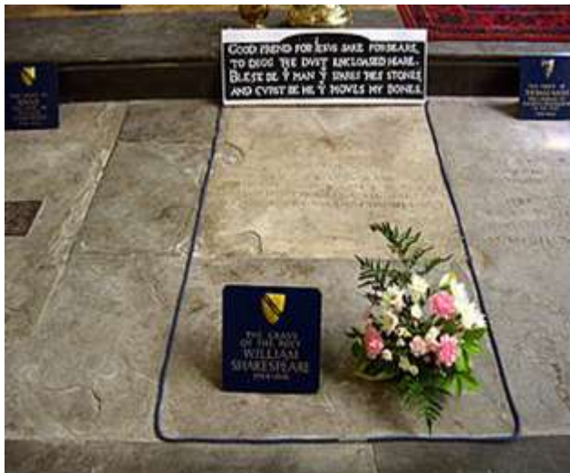
قبر شکسپیر، همسرش آن و همسر نوه اش

در تهیه سه نمایشنامه آخرش احتمالاً با "جان فلچر" همکاری داشت که پس از او به عنوان نمایشنامه نویس خانگی «مردان شاه» جانشین او شد. او در سال ۱۶۱۳، قبل از اینکه تئاتر گلوب در حین اجرای هنری هشتم در ۲۹ ژوئن بسوزد، بازنشسته شد. او در ۲۳ آوریل ۱۶۱۶ در سن ۵۲ سالگی در عرض یک ماه پس از امضای وصیت نامه اش درگذشت.