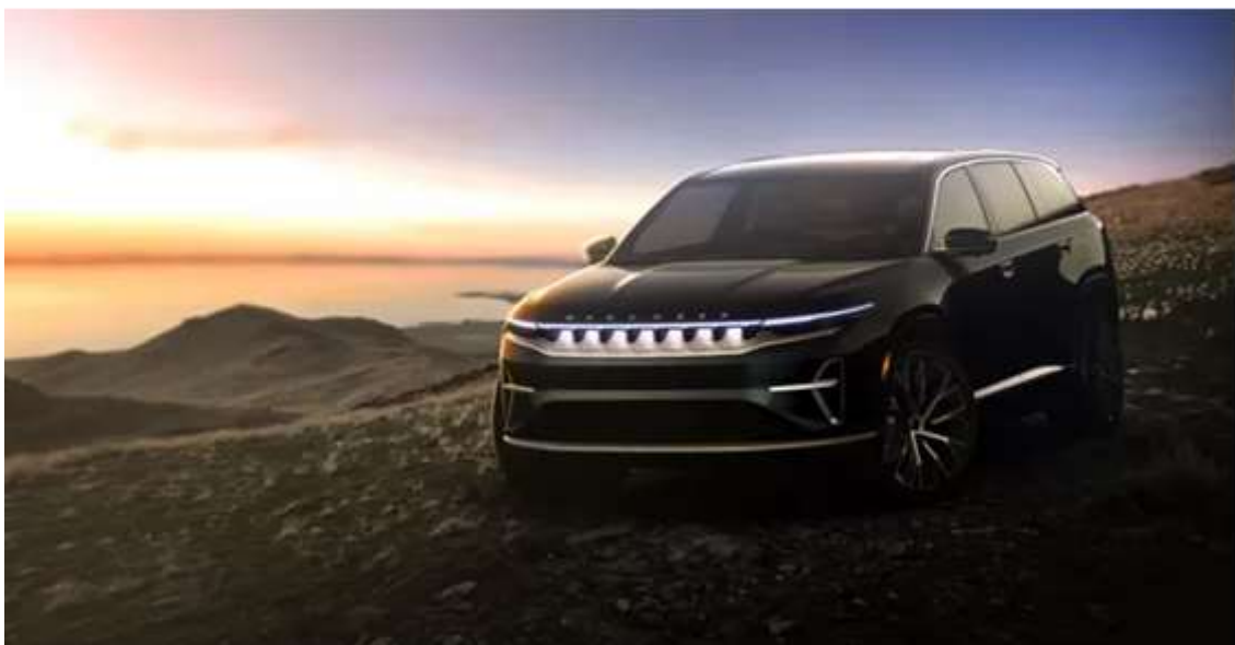
جیب واگونیر الکتریکی با شاسی بلندهای لوکس رقابت می‌کند

مدل الکتریکی بعدی جیب که در سال ۲۰۲۴ به بازار خواهد آمد ریکان (Recon) است. ریکان با الهام از جیب رانگلر طراحی شده و به گفته کارخانه برای کسانی ساخته می‌شود که می‌خواهند در سکوت در طبیعت رانندگی کنند. جیب این ماشین را ابتدا در آمریکا عرضه می‌کند و سپس آن را به اروپا و بازارهای دیگر صادر خواهد کرد. یکی از مشکلات جیب برای الکتریکی کردن محصولاتش، نبود زیرساخت کافی برای شارژ باتری در بسیاری از مناطق دورافتاده آمریکا است. جیب برای حل این مشکل اعلام کرده که در هشتاد نقطه از آمریکا شارژرهایی در مناطق دورافتاده نصب خواهد کرد که از انرژی خورشید نیرو می‌گیرند.