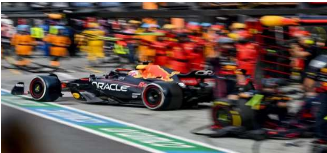
پورشه قصد داشت با همکاری با "ردبول" در مسابقات فرمول یک شرکت کند

اصلی را در انتخاب راننده برای تیم داشته باشند. قوانین ساخت موتور برای ماشین‌های مسابقات فرمول یک از سال ۲۰۲۶ تغییر می‌کند.