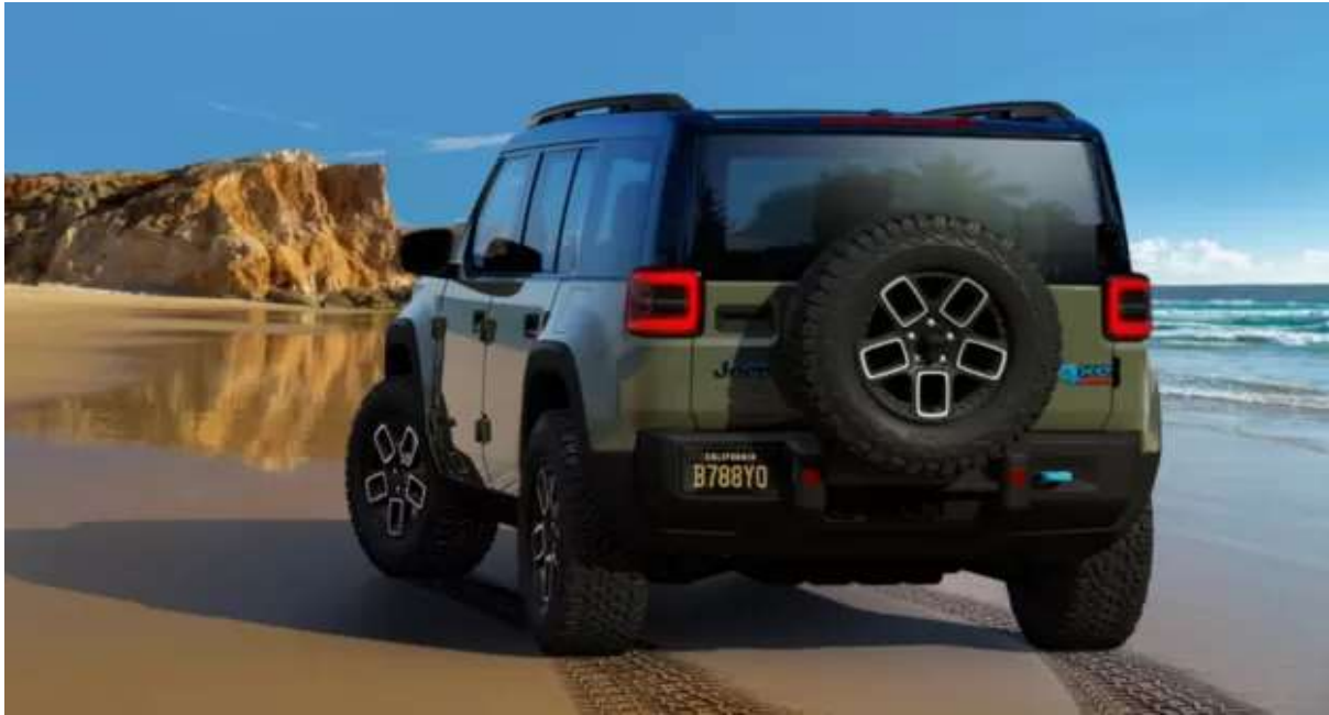
جیب ریکان در سال ۲۰۲۴ به بازار خواهد آمد

جیب در سال ۲۰۲۴ یک شاسی بلند الکتریکی دیگر هم به نام واگونیر (Wagoneer) به بازار عرضه خواهد کرد که بیشتر بر نیاز خانواده‌ها و لوکس بودن تمرکز دارد. این ماشین رقیبی برای شاسی بلندهای لوکس مانند رنج‌روور خواهد بود. جیب می‌گوید شتاب صفر تا ۹۶ کیلومتر در ساعت این مدل ۳٫۵ ثانیه است و با هر بار شارژ می‌تواند تا ۴۰۰ مایل (۶۴۳ کیلومتر) حرکت کند. جیب می‌خواهد بزرگ‌ترین تولیدکننده شاسی بلندهای الکتریکی در جهان باشد. این کارخانه اطلاعاتی درباره چهارمین مدل الکتریکی خود منتشر نکرده، اما می‌گوید این مدل مسیر آینده جیب را نمایش خواهد کرد.