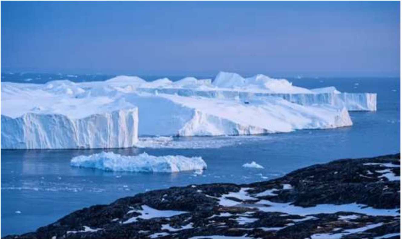
در حال حاضر ذوب یخسار گرینلند بزرگترین عامل بالا آمدن سطح دریاها است