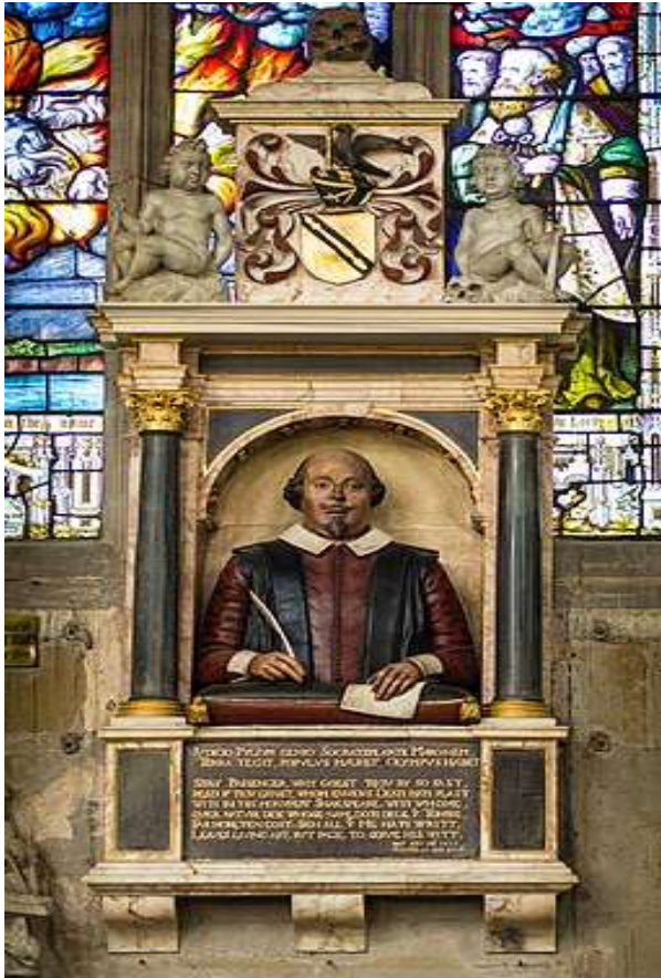
بنای یادبود تدفین شکسپیر در استراتفورد آیون آن

شکسپیر پس از سال ۱۶۱۰، نمایشنامه های کمتری نوشت و بعد از ۱۶۱۳ دیگر هیچ نمایشنامه ای به او نسبت داده نمی شود.