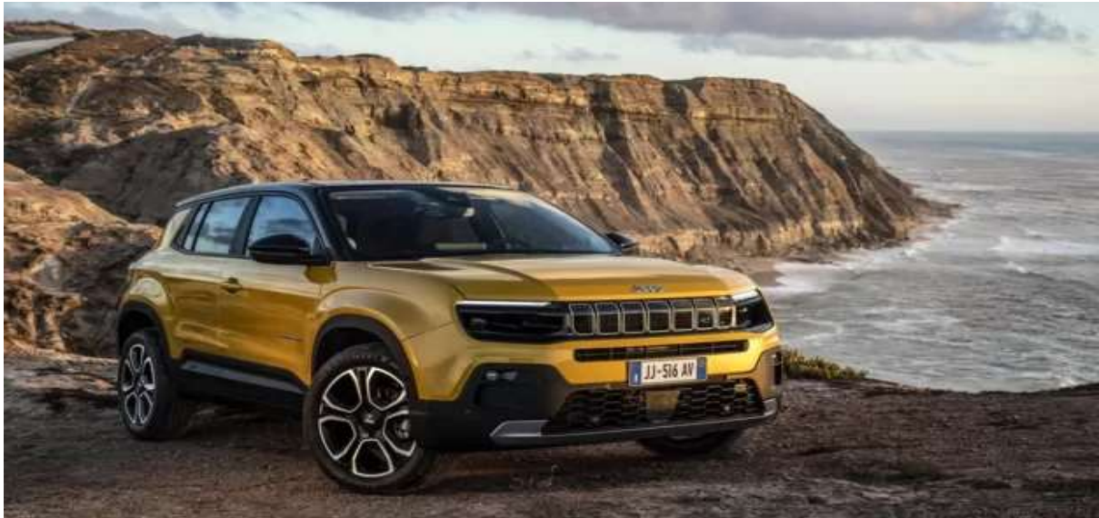
جیب اونجر سال آینده در اروپا تولید می‌شود

این هفته در جهان خودرو؛ برنامه تازه جیب برای ساخت ماشین‌های الکتریکی، رونمایی شاسی‌بلند الکتریکی ارزان شورت، لغو برنامه بوگاتی برای ساخت یک مدل شاسی‌بلند و سخت شدن کار پورشه برای حضور در مسابقات فرمول یک.