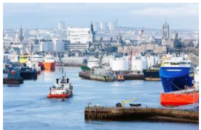
نمایی از بندرگاه ابردين

تاسیسات پذیرائی و اقامت: ابردين از لحاظ تاسیسات پذیرائی توریستی افزون بر دارا بودن هتل، متل و پانسیون‌های خصوصی مناسب به مهمانخانه هائی با عنوان (Bed & Breakfast) "تخت و صبحانه" که البته نسبت به شهرهای دیگر کمی گرانتر است، اما برای اقامت موقت یک یا دو شب مناسب است مجهز می‌باشد. با وجود این به دلیل فعالیت‌های اقتصادی نفتی و تعداد زیاد متقاضیان مسکن هزینه اقامت در واحدهای مسکونی خصوصی نسبتاً بالاست. اما در این شهر ساختمان‌هایی متعلق به شهرداری (Council flat) هم وجود دارد که با ثبت نام و قرار گرفتن در فهرست متقاضیان منازل و آپارتمان‌های خصوصی بسیار ارزانتر است.