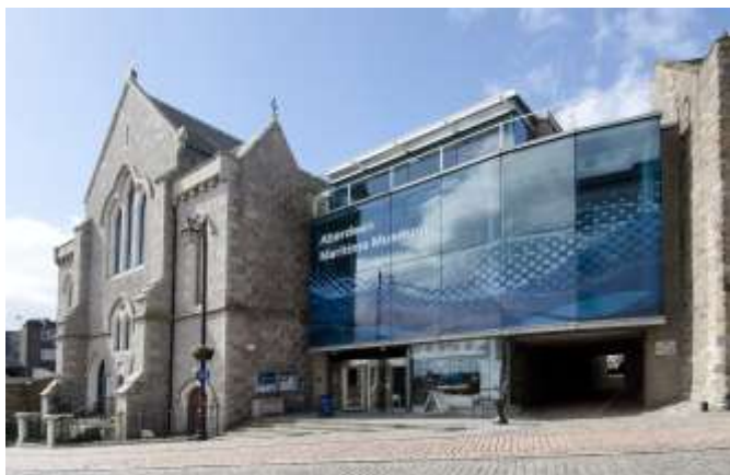
نمای موزه دریائی ابردين

بی نظیری از بندرگاه شلوغ ابردين به بازدیدکنندگان عرضه می‌کند. این موزه از دوشنبه تا شنبه، ۱۰ صبح تا ۵ بعد از ظهر، و یکشنبه‌ها ۱۲ ظهر تا ۳ بعد از ظهر به روی بازدیدکنندگان باز است. تسهیلاتی نظیر فروشگاه و کافه نیز در این موزه موجود است. برای کسب اطلاعات بیشتر در این زمینه می‌توان به وبسایت موزه‌های و گالری-های هنری ابردين مراجعه کرد.