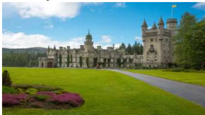
منظر قلعه بلمارل

موزه دریایی ابردين: موزه دریایی ابردين که بازگوکننده داستان رابطه طولانی شهر ابردين با دریا است در خیابان تاریخی Shiprow در مرکز شهر ابردين قرار گرفته است. موزه دریایی ابردين مجموعه بی نظیری از صنعت کشتی‌سازی، کشتی‌های سرعت بالا، ماهیگیری و تاریخچه بندر را در خود جای داده است. این موزه همچنین تنها مکان در کل پادشاهی متحده است که در آن شما می‌توانید نمایشی از صنعت نفت و گاز دریای شمال ببینید. موزه دریایی ابردين، نمای