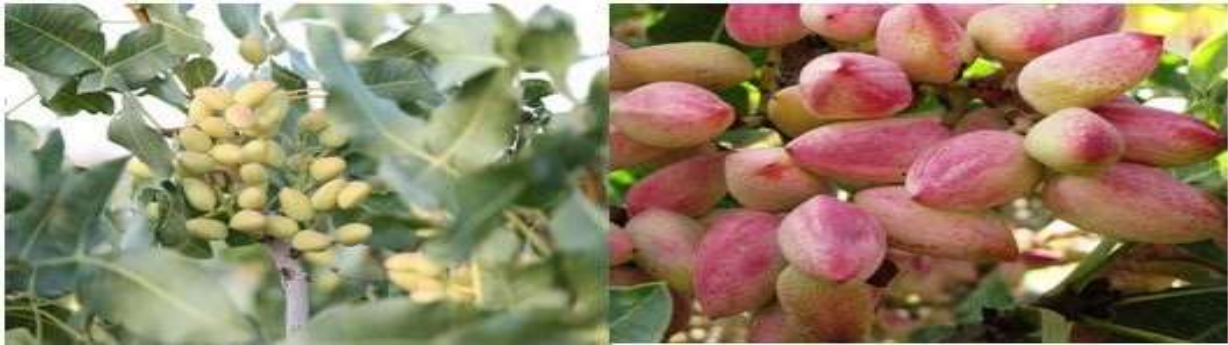
دایش پسته در ایران به ۴۰۰۰ تا ۵۰۰۰ سال پیش باز می‌گردد. خاستگاه اولیه درخت پسته به دوره هخامنشی و نواحی خراسان در ایران نیز نسبت داده شده است.

پیدایش پسته در ایران به ۴۰۰۰ تا ۵۰۰۰ سال پیش برمی‌گردد. خاستگاه اولیه درخت پسته به دوره هخامنشی و نواحی خراسان در ایران نیز نسبت داده شده است. درخت پسته در زبان‌های یونانی، لاتین، اروپایی، عربی، ترکی، روسی، ژاپنی و دیگر زبان‌ها از نام ایرانی آن گرفته شده است. نام درخت این محصول در زبان پارسی "پیستاکو" بود و سپس به پسته تبدیل شده است. باغ‌های پسته در ایران از همان زمان ایجاد شدند.