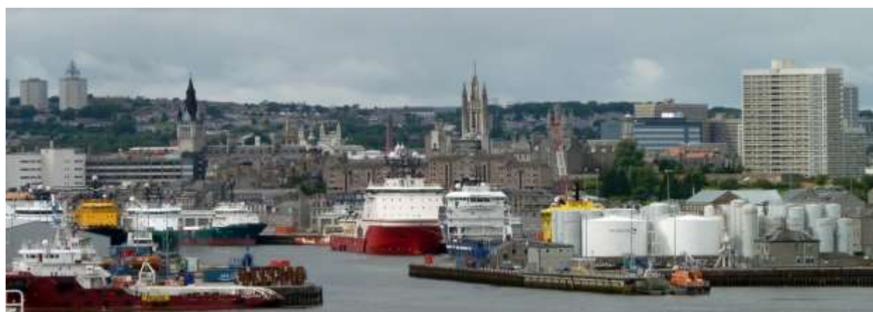
نمایی از شهر ابردين

شهر بندری ابردين که به شهر سنگ خارا (Granite City) معروف است، در شمال شرقی کشور اسکاتلند واقع است، و به دليل نزديکی به مخازن نفتی دریایی و حضور فعال شرکت‌های نفتی در آن، به پایتخت نفتی اروپا شهرت یافته است. ابردين افزون بر این که از دير باز همواره شهری دانشگاهی و تفریح گاه اشراف شکارچی اکاتلند و انگلاند بوده است، بندر اصلی و مرکز تجاری شمال شرقی اسکاتلند است.