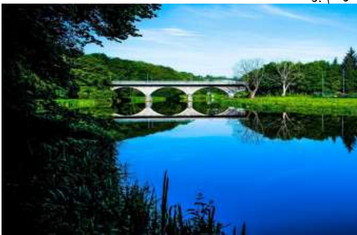
نمایی از رودخانه دی

آب و هوای آبردین، آب و هوائی دریائی است، به این معنا که بر خلاف تصور در زمستان معتدل است و بسیار خنک تر از مورد انتظار، آن هم در نقطه یی شمالی، هرچند از نظر آماری سردترین شهر انگلیس است. در زمستان طول روز، به خصوص در ماه دسامبر، بسیار کوتاه است، به طور متوسط ۶ ساعت و ۴۱ دقیقه بین طلوع آفتاب و غروب خورشید است. اما با پیشرفت زمستان، طول روز نسبتاً افزایش می یابد و تا پایان ژانویه به ۸ ساعت و ۲۰ دقیقه می رسد. روزها در تابستان حدود ۱۸ ساعت است و بین طلوع