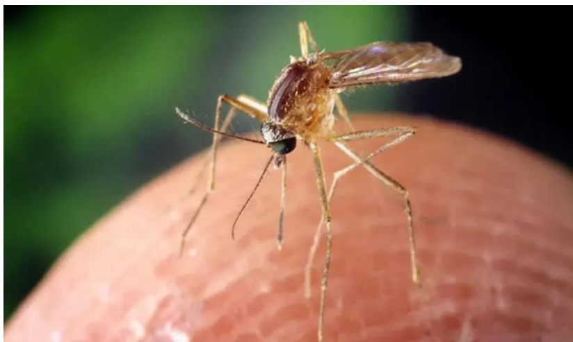
دیوید کاکس بی‌بی‌سی فارسی

اخیرا آنتونی فاوچی، بعد از سال‌ها فعالیت حرفه‌ای موفق به‌عنوان یکی از پیشروترین محققان در زمینه ویروس اچ‌آی‌وی و هدایت برنامه دولت ایالات متحده آمریکا برای مقابله با همه‌گیری کووید-۱۹، به علت بیماری در بیمارستان بستری شد. آنچه او را به تخت بیمارستان کشاند، ویروسی بسیار متفاوت با همه ویروس‌هایی بود که با آنها سروکار داشت. این دانشمند ۸۳ ساله اخیرا، بعد از ابتلا به ویروس نیل غربی نشانه‌هایی مانند تب، لرز و خستگی از خود نشان داد. ویروس نیل غربی، اولین بار در سال ۱۹۳۹ در اوگاندا مشاهده شد. اما آقای فاوچی در شرق آفریقا دچار این بیماری نشد. یک پشه او را در باغچه پشت خانه‌اش نیش زد. اخیرا ابتلا به این بیماری با نیش پشه بیشتر از قبل شایع شده است. مرکز کنترل و پیشگیری از بیماری (سی‌دی‌سی) به بی‌بی‌سی گفت سالانه ۲ هزار شهروند آمریکایی بر اثر ابتلا به ویروس نیل غربی بیمار می‌شوند. از این تعداد ۱۲۰۰ مورد دچار بیماری‌های سیستم عصبی می‌شوند که می‌تواند خطر جانی داشته باشد، و بیش از ۱۲۰ نفر جان خود را از دست می‌دهند.