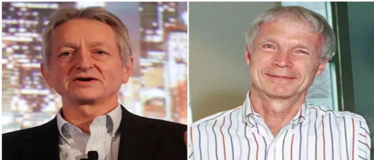
جان هاپفیلد و جفری هینتون