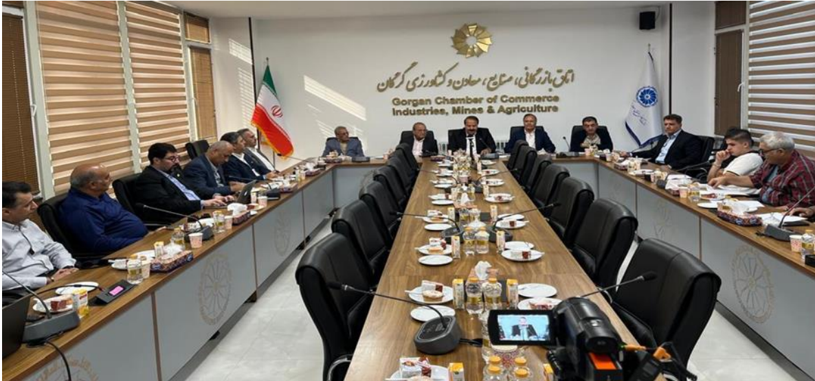
حضور اعضاء هیات در اتاق بازرگانی گرگان

هیات گردهمایی آزاد اعضاء که بنا به تصویب هیات مدیره قرار شد در استان گلستان برگزار شود صبح چهارشنبه ۲۵ مهر ماه تهران را از جلوی اتاق مشترک در خیابان ولی عصر به مقصد استان گلستان ترک کرد.