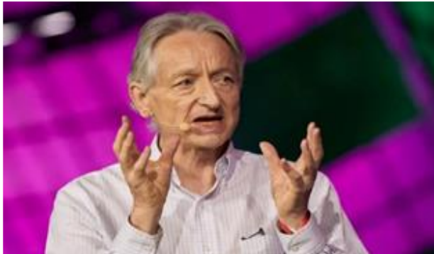
پروفسور هینتون قبلاً درباره خطرات هوش مصنوعی هشدار داده بود

جفری هینتون، ۷۶ ساله و استاد دانشگاه تورنتو در کانادا، روشی را ابداع کرد که می‌تواند مستقلاً ویژگی‌های مشخصی را در داده‌ها تشخیص دهد و کارهایی مانند شناسایی عناصر خاص در تصاویر را انجام دهد. ارزش نقدی این جایزه ۱۱ میلیون کرون سوئد (حدود یک میلیون و ۶۰ هزار دلار) است که بین این دو نفر تقسیم می‌شود. یادگیری ماشین در صنعت هوش