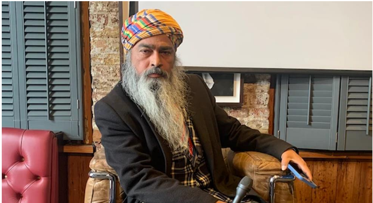
استفان ملا تازه ترین فردی است که ادعا می کند مخترع مرموز بیت کوین است