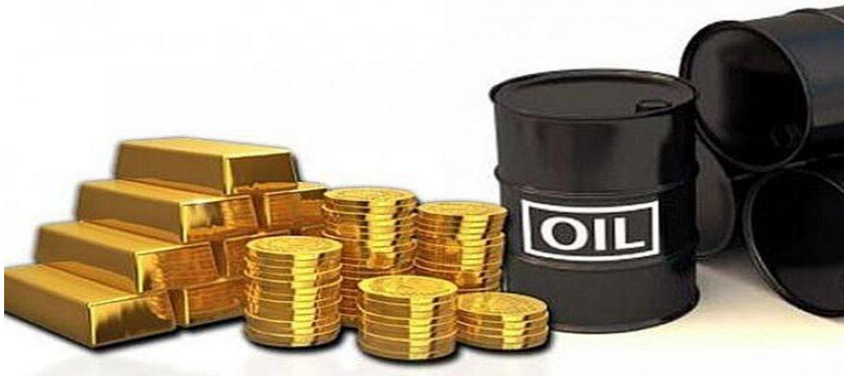
بهای طلای سیاه در معاملات امروز بازار جهانی افزایش یافت

به گزارش خبرگزاری مهر به نقل از رویترز، نگرانی ها از تشدید تنش ها در اوکراین به دلیل اجازه غرب به کی یف برای استفاده از موشک های دوربرد در عمق خاک روسیه، و از سوی دیگر امیدواری ها برای افزایش تقاضا از سوی چین باعث شد بهای نفت امروز در بازار جهانی روند صعودی داشته باشد.