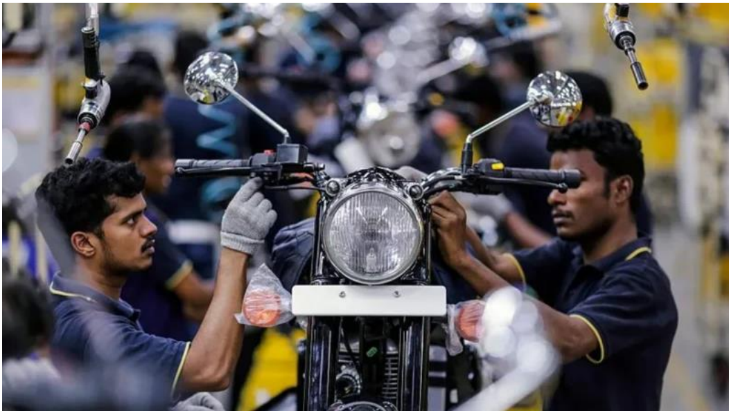
کارگران در یک کارخانه در چنای هند موتورسیکلت مونتاژ می کنند