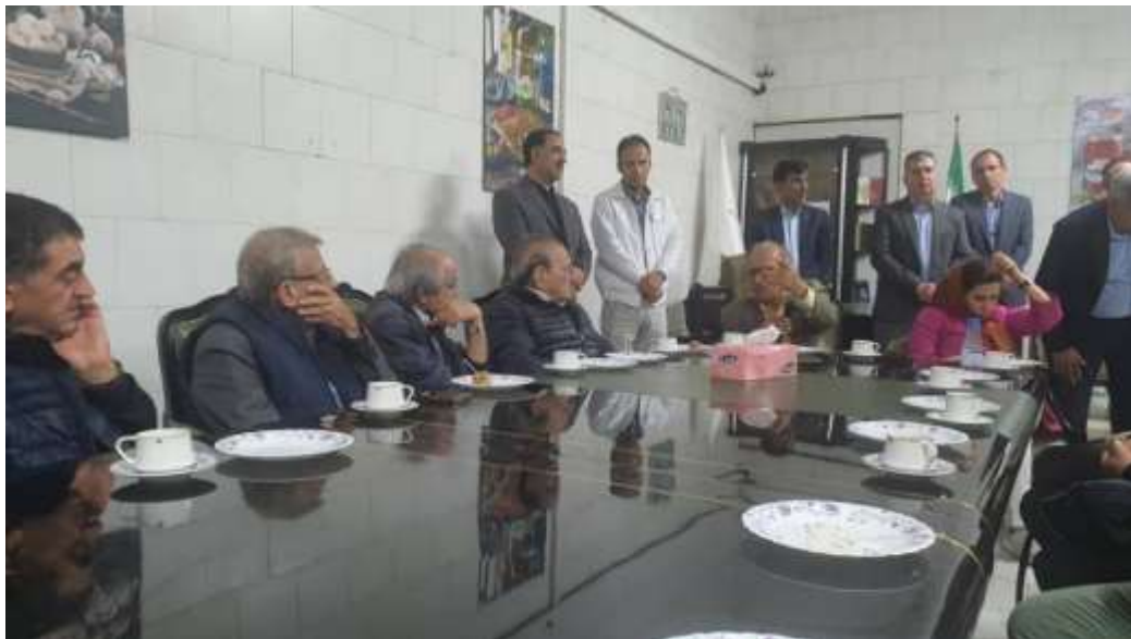
هیات در پذیرایی اروم آدا