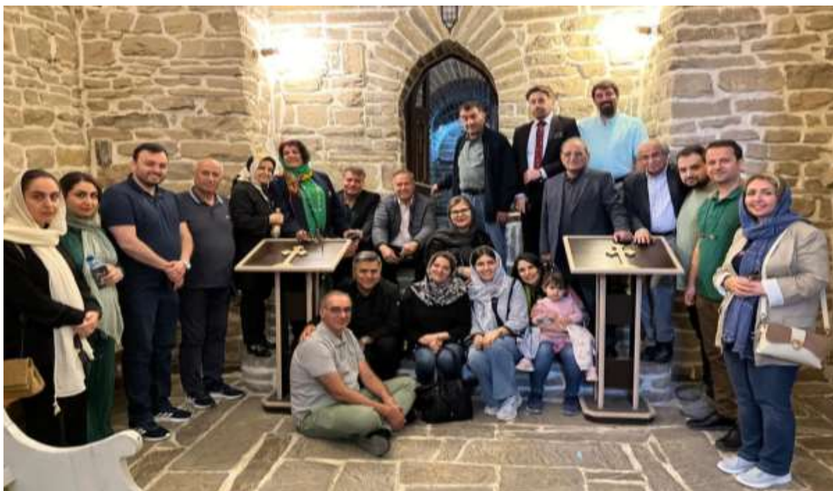
هیات در محوطه کلیسای ننه مریم که از تبدیل یک آتشکده زرتشتی ایجاد شده است.

روز سوم که به گشت و گذار اختصاص داشت هیات بعداز صرف صبحانه عازم گشت و گذار در شهر شد و از کلیساهای "ننه مریم" که پیش از این آتشکده یی بوده است و کلیسای "مریم مقدس" بازدید به عمل آورد و در خیابان خیام که به لاله زار ارومیه معروف است به توصیه افشین نوبخت به صرف قهوه ترک ویژه شهر روی آور شد که روی ماسه داغ به عمل می آید رفت و در فضای باز خیابان به گشت و گذار پرداخت.