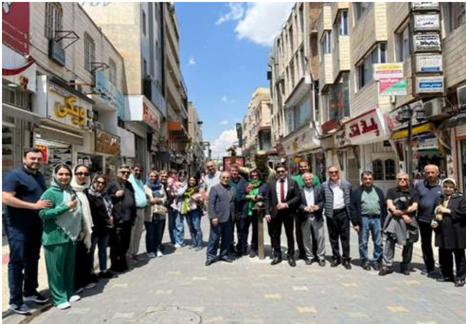
گروهی از اعضا در داخل شهر ارومیه (خیابان خیام)