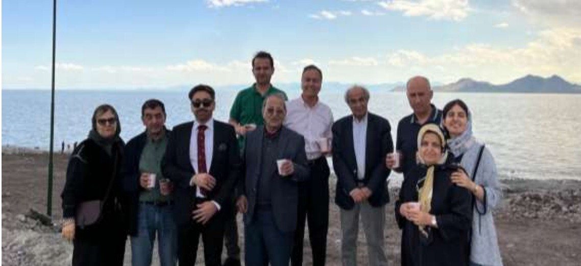
گروهی از اعضا در مسیر ارومیه- تبریز(روی پل برفراز دریاچه)

فهرست مطالب: سخن ماه، اخبار کوتاه اتاق های ایران و انگلیس و بریتانیا و ایران، اخبار اقتصادی ایران و جهان، گزارش ویژه