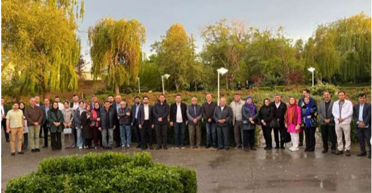
هیات و برخی اشخاص و همکاران "اروم آد" در محوطه وسیع و زیبای واحد تولیدی "اروم آد"

فهرست مطالب: سخن ماه، اخبار کوتاه اتاق های ایران و انگلیس و بریتانیا و ایران، اخبار اقتصادی ایران و جهان، گزارش ویژه