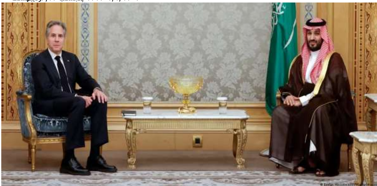
آمریکا و عربستان در حال مذاکره برای رسیدن به یک توافق امنیتی هستند