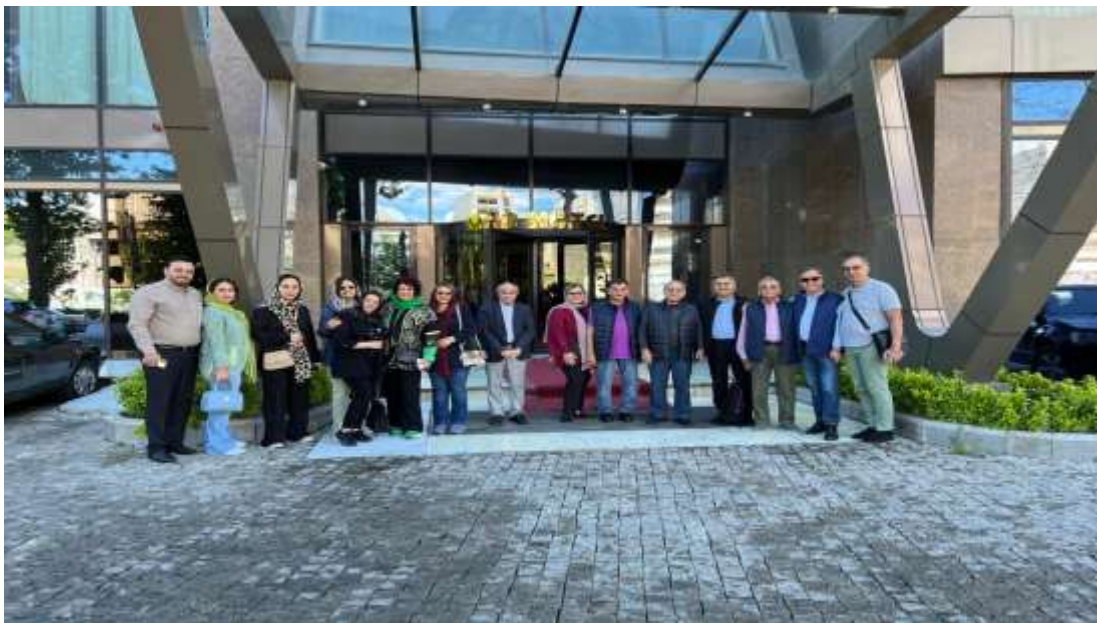
تعدادی از اعضای هیات در ورودی هتل "آنا" هنگام ترک هتل و در انتظار اتوبوس