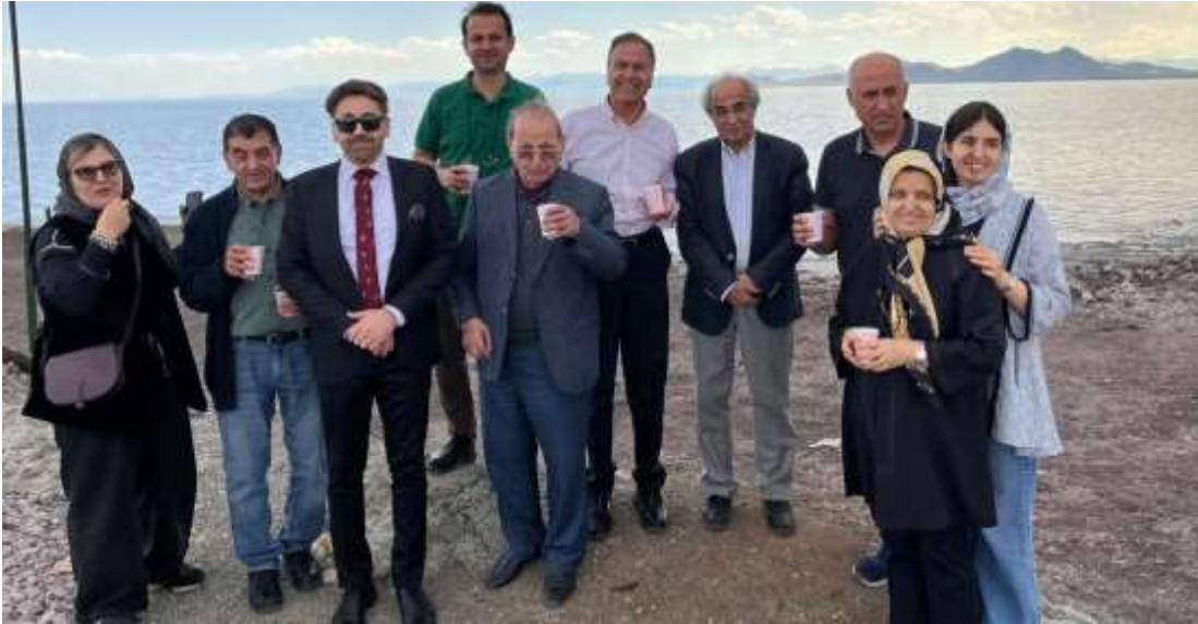
گروهی از اعضای هیات در مسیر بازگشت از ارومیه به تبریز و در کنار دریاچه ارومیه

فهرست مطالب: سخن ماه، اخبار کوتاه اتاق های ایران و انگلیس و بریتانیا و ایران، اخبار اقتصادی ایران و جهان، گزارش ویژه