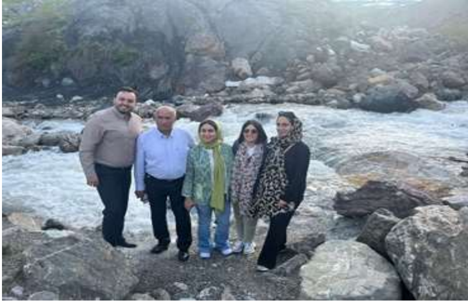
گروهی از اعضا در مسیر آبشار جاری به دریاچه

فهرست مطالب: سخن ماه، اخبار کوتاه اتاق های ایران و انگلیس و بریتانیا و ایران، اخبار اقتصادی ایران و جهان، گزارش ویژه