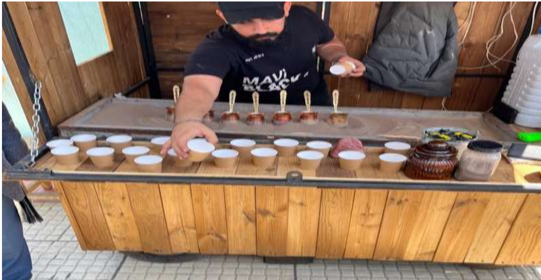
عرضه قهوه روی ماسه داغ در خیایان خيام