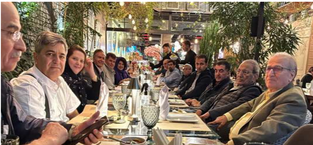
پذیرائی از هیات در اروم آدا