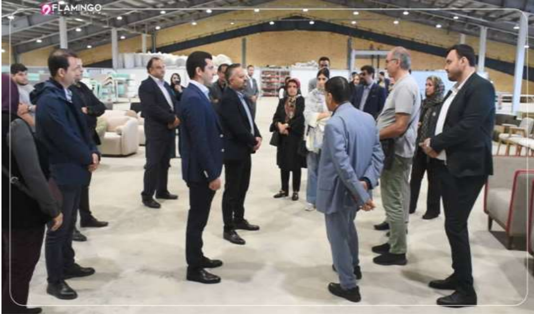
گروهی از اعضاء در کارگاه فلامینگو

فهرست مطالب: سخن ماه، اخبار کوتاه اتاق های ایران و انگلیس و بریتانیا و ایران، اخبار اقتصادی ایران و جهان، گزارش ویژه