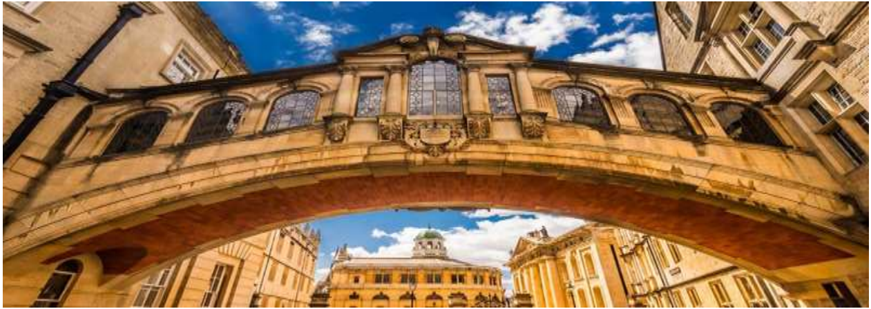
پل هرتفورد، به سمت خیابان کته، با تئاتر شلدونین در پس‌زمینه

افسانه‌یی وجود دارد که چندین دهه پیش، یک نظرسنجی در مورد سلامت دانش‌آموزان انجام شد و از آنجایی که دانشجویان کالج هرتفورد سنگین‌ترین بودند، کالج پل را بست تا آنها را مجبور به بالا رفتن از پله‌ها کند و به آنها ورزش اضافی بدهد. با این حال، اگر از پل استفاده نشود، دانش‌آموزان در واقع از پله‌های کمتری نسبت به زمانی که از پل استفاده می‌کنند بالا می‌روند. این پل چهارگوش قدیمی و جدید بنا به اشاره دویبخش شمال و جنوب کالج هرتفورد را به هم متصل می‌کند و بیشترین معماری فعلی آن توسط سر توماس جکسون طراحی و در سال ۱۹۱۴ تکمیل شد، دفاتر اداری کالج در ساختمان ضلع جنوبی پل قرار دارند، در حالی که ساختمان شمالی بیشتر محل اقامت دانشجویان است. پل همیشه به روی اعضای کالج باز است.